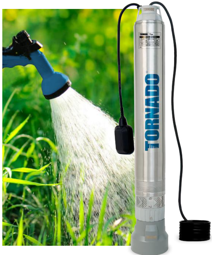
TABLA DE ESPECIFICACIONES